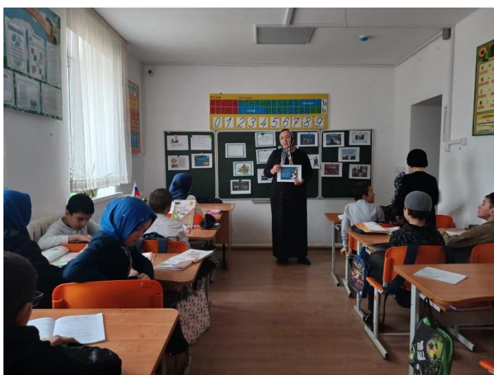
08.01.2024г классный час «История прокуратуры 5 класс . Охват 13 учащихся.